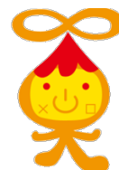
開志学園キャラクター カイシくん

普段の学習は、学校から貸与される iPadやPC、スマートフォンなどを使ってオンライン学習。映像授業を視聴(放送視聴)しながら、レポート作成(添削課題)まで、自分のペースで学習を進めていきます。