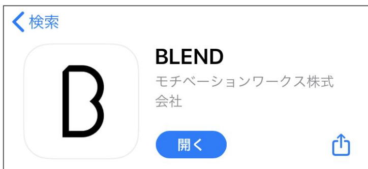
App Storeからインストールをお願いします